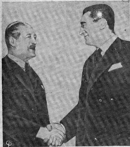
El Primer Ministro británico Harold MacMillan (izquierda) se reúne en París con el Premier francés Felix Gaillard para tratar de restablecer la unidad de la OTAN y terminar la tensión creada por los embarques de armas inglesas y norteamericanas a Túnez.

TRATAN DE RESTABLECER UNIDAD DE O.T.A.N.